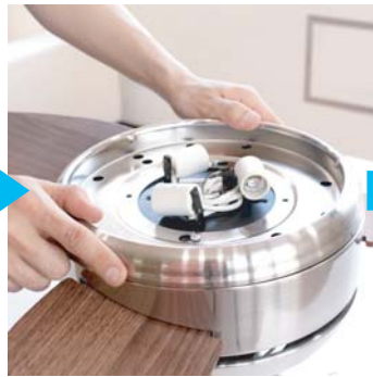
⑤下部パーツを戻します。