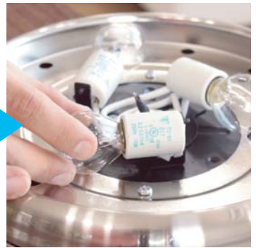
⑦クリプトン球（3つ）を取付けます。