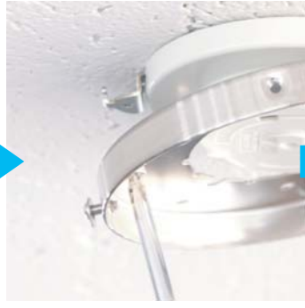
②ローゼットの羽（2箇所）と先ほどはずした2箇所付属のネジで取付けます。