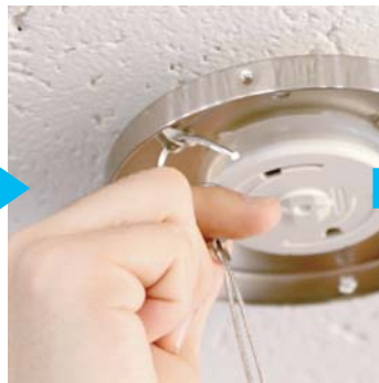
⑨ソケットカバー内の安全ワイヤーを天井金具のフックに取付けます。