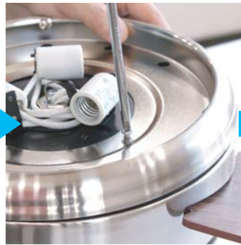
⑥下部パーツのネジを締めます。