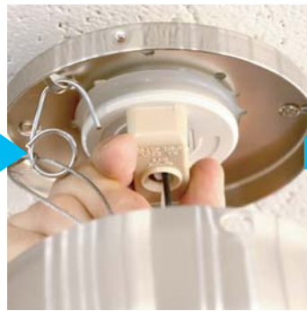
⑩引っ掛けシーリングを取付けます。