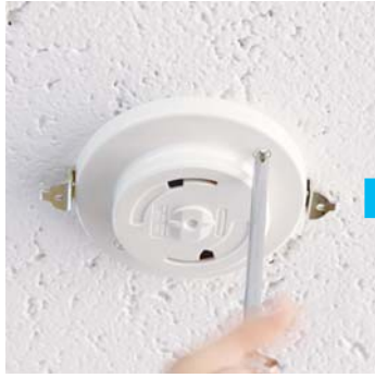
①ローゼットのネジ（2箇所）をはずします。