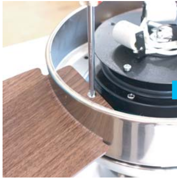
④プロペラを取付けます。