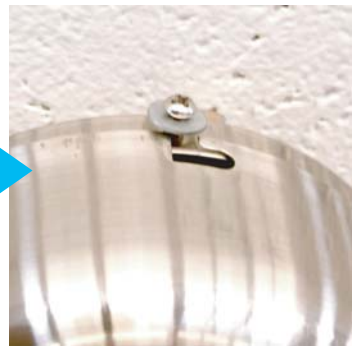
⑪ソケットカバーのネジを締め（4箇所）本体を天井に固定します。 注）L字型のミゾ（2箇所）から取付けてください。