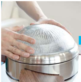
⑧ランプカバーのガラスをはめます。