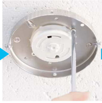
注）4箇所の穴に合う位置に合わせて取付けてください。