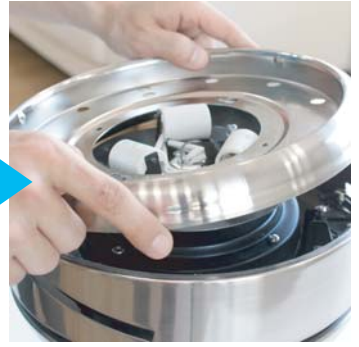
③本体下部のパーツのネジをはずして取外します。